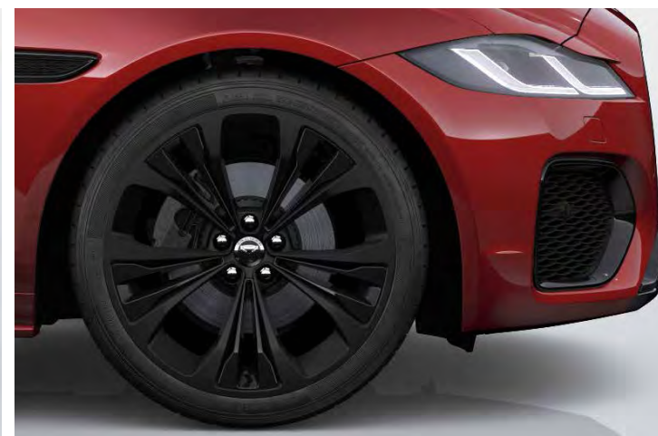
20" 'STYLE 5107' SATIN BLACK MET ACCENTEN IN GLOSS BLACK