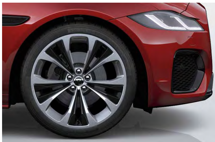
20" 'STYLE 5107' GLOSS SPARKLE SILVER MET ACCENTEN IN GLOSS BLACK