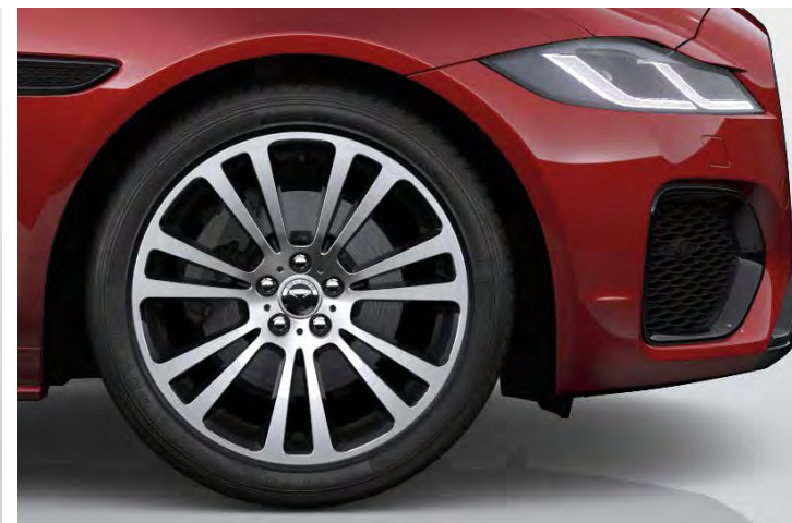
19" 'STYLE 7013' GLOSS BLACK & CONTRAST DIAMOND TURNED FINISH Standaard op XF R-DYNAMIC SE