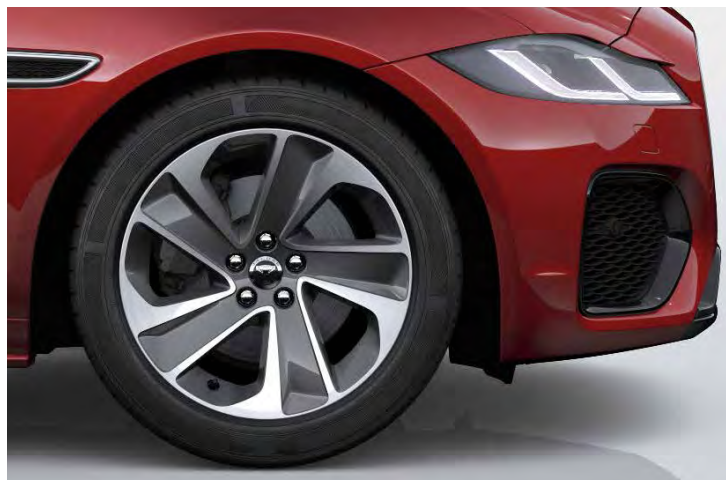
18" 'STYLE 5105' DARK GREY & CONTRAST DIAMOND TURNED FINISH Standaard op XF R-DYNAMIC S

Er is keuze uit een uitgebreid programma lichtmetalen velgen. De maten variëren van 18" tot 20". De markante designkenmerken voegen stuk voor stuk hun specifieke karakter toe aan de uitstraling van de auto. In de configurator op jaguar.nl kunt u zien welke velgen beschikbaar zijn voor uw gewenste uitvoering.