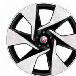
20" 6-SPOKE 'STYLE 6007' GLOSS DARK GREY & CONTRAST DIAMOND TURNED FINISH