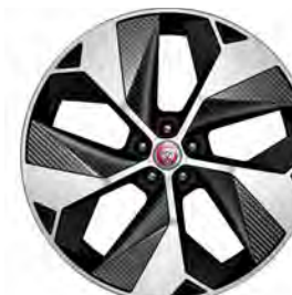
22" 5-SPOKE 'STYLE 5069' GLOSS BLACK & CONTRAST DIAMOND TURNED FINISH MET INZETTEN IN CARBON FIBRE'