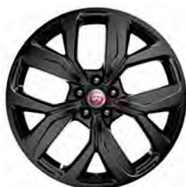
20" 5-SPOKE 'STYLE 5068' GLOSS BLACK