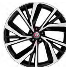
22" 5-SPLIT SPOKE 'STYLE 5056' GLOSS DARK GREY & CONTRAST DIAMOND TURNED FINISH'