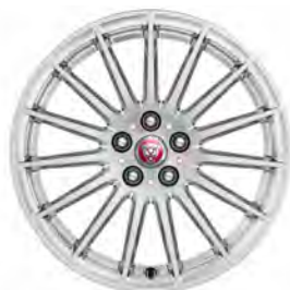
18" 15-SPOKE 'STYLE 1022' GLOSS SPARKLE SILVER (Standaard op S)

Er is keuze uit een uitgebreid programma lichtmetalen velgen. De maten variëren van 18" tot een bijzonder aantrekkelijke 22". De markante designkenmerken voegen stuk voor stuk hun specifieke karakter toe aan de uitstraling van de auto. In de configurator op jaguar.nl kunt u zien welke velgen beschikbaar zijn voor uw gewenste uitvoering.