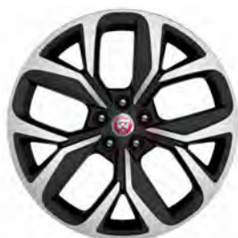
20" 5-SPOKE 'STYLE 5068' GLOSS DARK GREY & CONTRAST DIAMOND TURNED FINISH (Standaard op HSE)