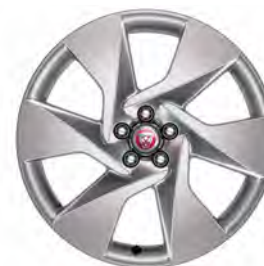
20" 6-SPOKE 'STYLE 6007' GLOSS SPARKLE SILVER (Standaard op SE)