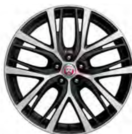
20" 5-SPLIT SPOKE 'STYLE 5070' POLISHED TECHNICAL GREY