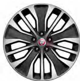
19" 5-SPLIT SPOKE 'STYLE 5055' GLOSS DARK GREY & CONTRAST DIAMOND TURNED FINISH'