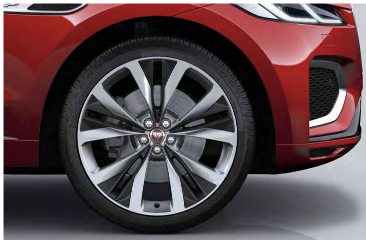
22" 15-SPOKE 'STYLE 1020' GLOSS SILVER & CONTRAST INSERTS