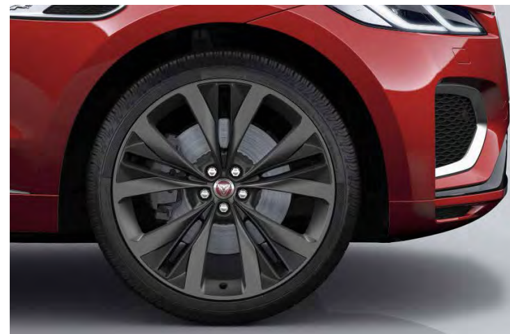
22" 15-SPOKE 'STYLE 1020' GLOSS GREY & CONTRAST INSERTS