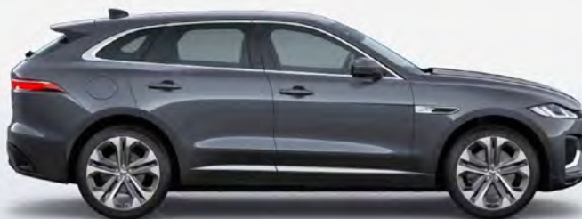
ULTRA METALLIC AMETHYST GREY-PURPLE