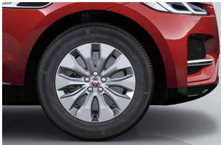
18" 10-SPOKE 'STYLE 1021' GLOSS SPARKLE SILVER Standaard op F-PACE D165, D200, P250

Er is keuze uit een uitgebreid programma lichtmetalen velgen. De maten variëren van 18" tot 22". De markante designkenmerken voegen stuk voor stuk hun specifieke karakter toe aan de uitstraling van de auto. In de configurator op jaguar.nl kunt u zien welke velgen beschikbaar zijn voor uw gewenste uitvoering.