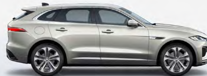
ULTRA METALLIC FLUX SILVER HOOGGLANS OF SATIJNGLANS