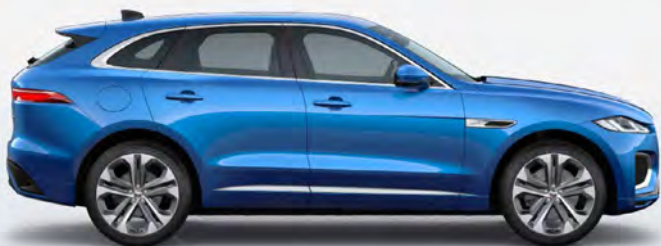
ULTRA METALLIC VELOCITY BLUE HOOGGLANS OF SATIJNGLANS