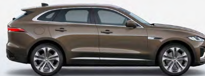
ULTRA METALLIC TOURMALINE BROWN HOOGGLANS OF SATIJNGLANS