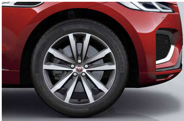
20" 5-SPLIT SPOKE 'STYLE 5031' GLOSS GREY & CONTRAST DIAMOND TURNED FINISH Standaard op F-PACE R-Dynamic SE