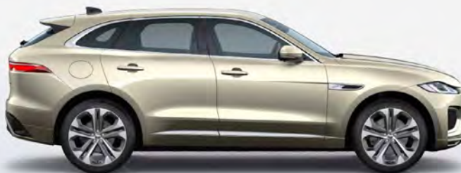
ULTRA METALLIC SUNSET GOLD