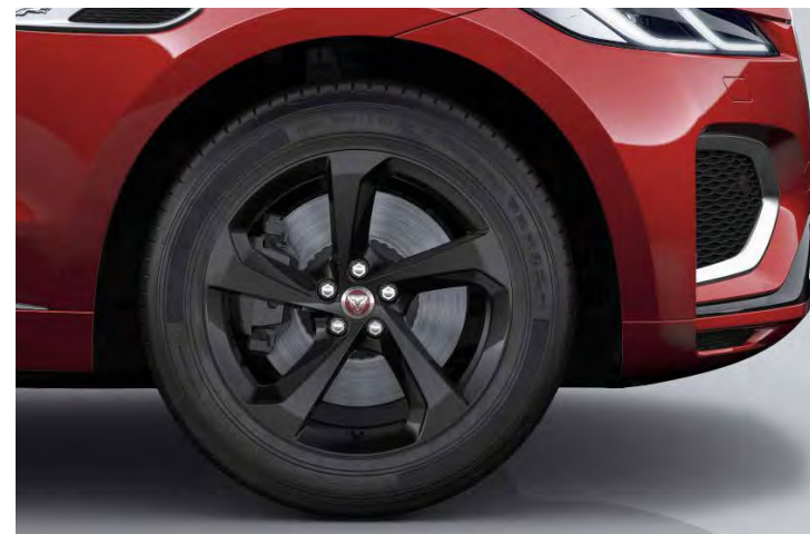
19" 5-SPOKE 'STYLE 5037' GLOSS BLACK Standaard op F-PACE R-Dynamic S