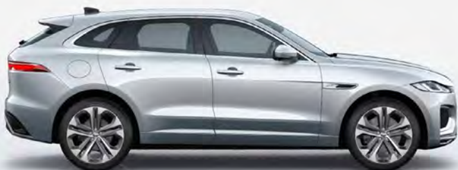
ULTRA METALLIC IONIAN SILVER HOOGGLANS OF SATIJNGLANS