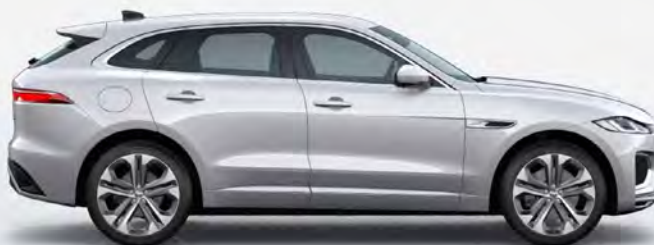
ULTRA METALLIC ETHEREAL FROST SILVER HOOGGLANS OF SATIJNGLANS