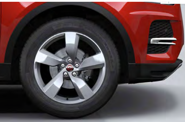
19" 5-SPOKE 'STYLE 5049' GLOSS SPARKLE SILVER Standaard op E-PACE SE