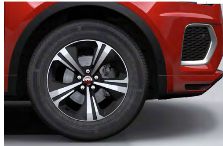
18" 5-SPOKE 'STYLE 5118' SATIN BLACK & CONTRAST DIAMOND TURNED FINISH Standaard op E-PACE R-Dynamic S