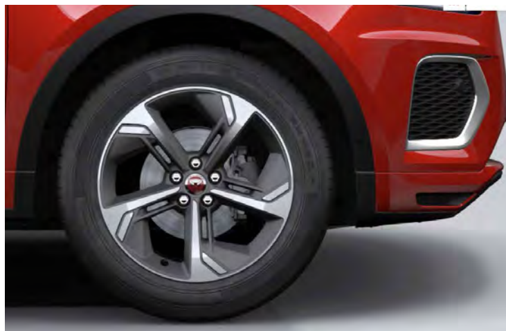
19" 5-SPOKE 'STYLE 5119' SATIN DARK GREY & CONTRAST DIAMOND TURNED FINISH Standaard op E-PACE R-Dynamic SE