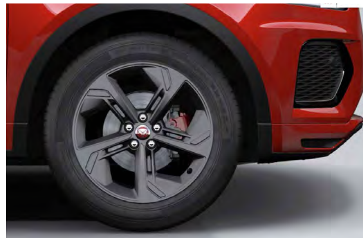
19" 5-SPOKE 'STYLE 5119' SATIN DARK GREY