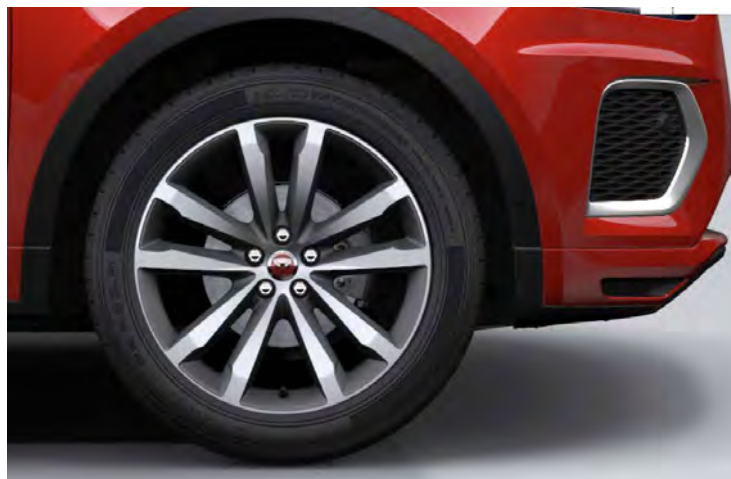
20" 5-SPLIT SPOKE 'STYLE 5051' SATIN GREY & CONTRAST DIAMOND TURNED FINISH