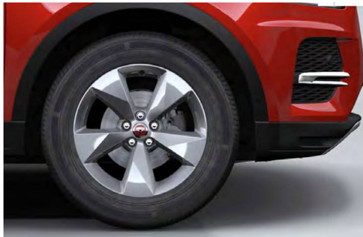
18" 5-SPOKE 'STYLE 5048' GLOSS SPARKLE SILVER Standaard op E-PACE S

Er is keuze uit een uitgebreid programma lichtmetalen velgen. De maten variëren van 18" tot 21". De markante designkenmerken voegen stuk voor stuk hun specifieke karakter toe aan de uitstraling van de auto. In de configurator op jaguar.nl kunt u zien welke velgen beschikbaar zijn voor uw gewenste uitvoering.