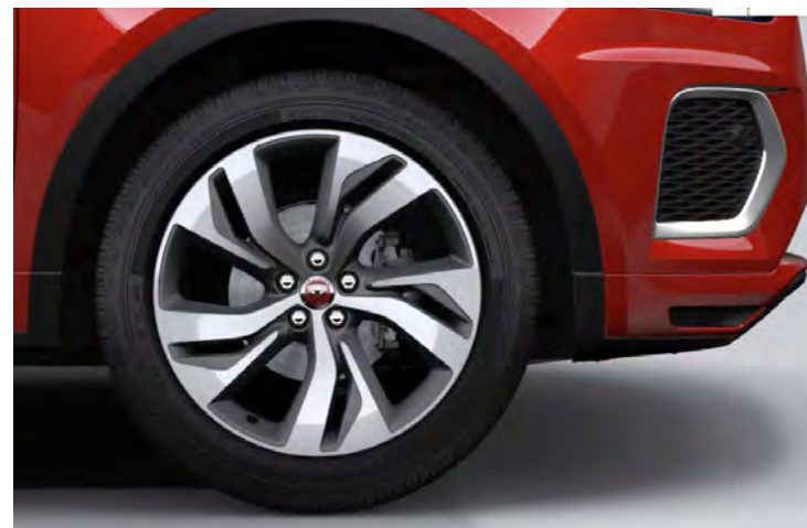
20" 5-SPLIT SPOKE 'STYLE 5120' SATIN DARK GREY & CONTRAST DIAMOND TURNED FINISH Standaard op E-PACE R-Dynamic HSE & E-PACE 300 Sport