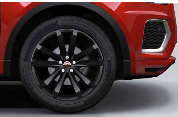
20" 5-SPLIT SPOKE 'STYLE 5051' GLOSS BLACK